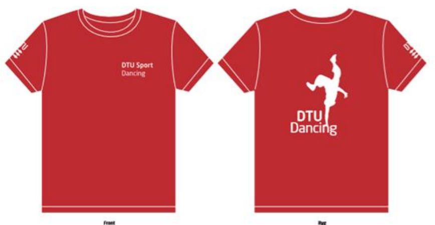
Eksempel: tryk på T-shirt.

DTU Sport forbeholder sig ret til at trække tilskuddet tilbage, såfremt de originale DTU-farver ikke er autentiske (se punktet DTU's design-retningslinjer) eller trykket ikke lever op til retningslinjerne eller tilskudsreglerne